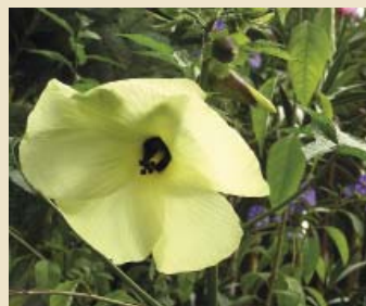
A kénsárga színű mocsári mályva még inkább

Sok ceglédi kertben találkozhattunk vele, de a legszebb sarokház, ahol az utcai fron-