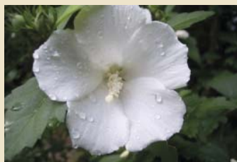
A hófehér színben Magyarországon is ritka

fagynak, ezért takarással kell védeni. Általában a komposztos takarást használják, de megfelel a nem túl kötött termőföld is. A vesszőket kora tavasszal, márciusban kb. 5–6