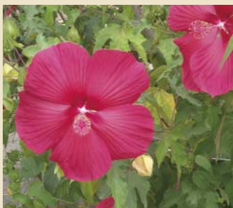
Sötét piros alig van másutt Cegléden